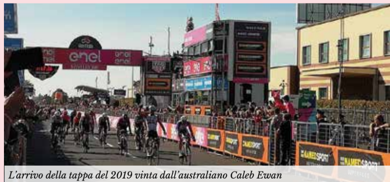
L'arrivo della tappa del 2019 vinta dall'australiano Caleb Ewan

La frazione Imperia - Novi Ligure segnerà il quinto storico arrivo della Corsa Rosa nella nostra città, consolidando un legame iniziato il 29 maggio 1965 con il successo di Danilo Grassi nella breve tappa da Milano. Nel 1978, la città fu addirittura teatro dell'assegnazione della prima maglia rosa dell'edizione, conquistata in volata dal belga Rik Van Linden, mentre il 13 maggio 2010 fu il francese Jerome Pineau a imporsi sul traguardo della Novara-Novu. L'ultimo precedente in ordine cronologico risale al 22 maggio 2019, quando l'australiano Caleb Ewan vinse lo sprint finale davanti allo stabilimento Novi