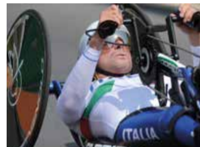
Il campione di handbike Vittorio Podestà