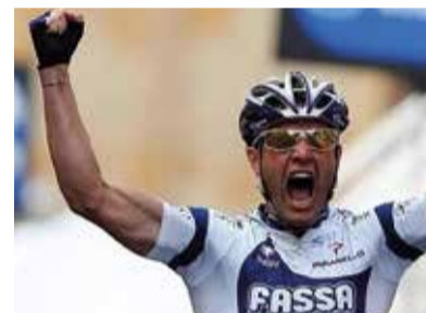
Il velocista e specialista di corse a tappe Alessandro Petacchi